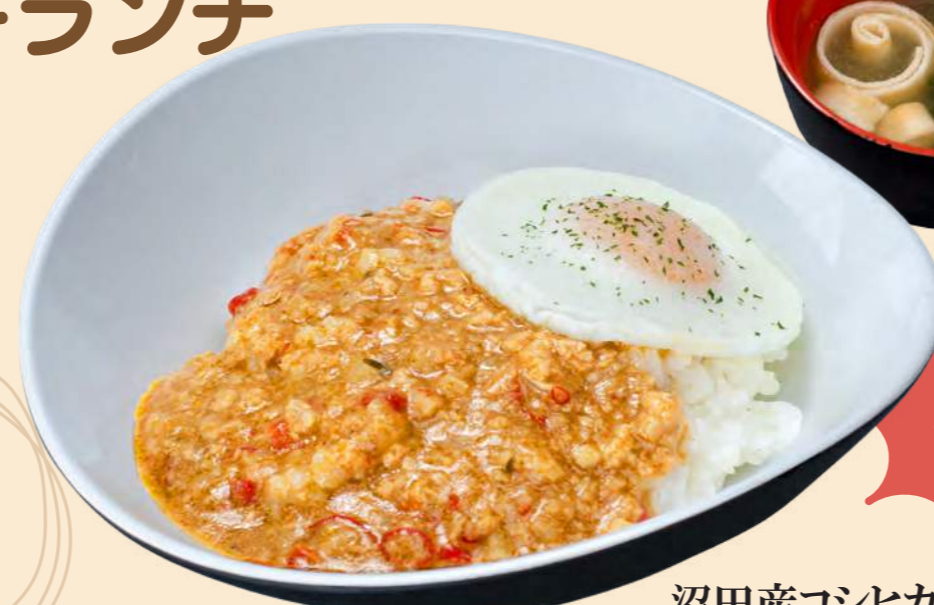
沼田産コシヒカリ稲姫米を使用 NEW 旨辛ガパオ丼 1,200円