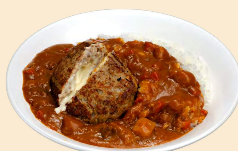
沼田産コシヒカリ稲姫米を使用 ち〜ずいん ハンバーグカレー 1,300円