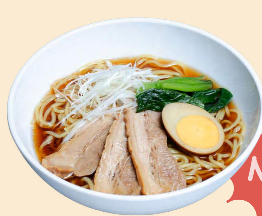
NEW ぐんま豚醤油ラーメン 1,200円 (麺大盛 + 300円)