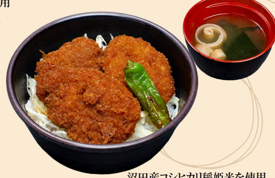
沼田産コシヒカリ稲姫米を使用 上州名物ソースカツ丼 1,200円 (ライス大盛 + 300円)