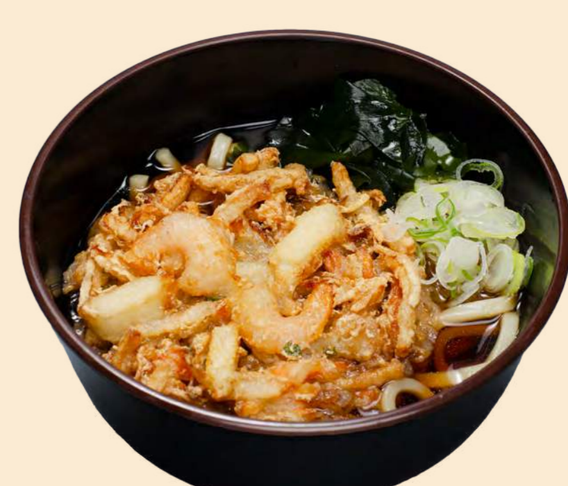
海鮮かき揚げうどん 1,000円 (麺大盛 + 300円)