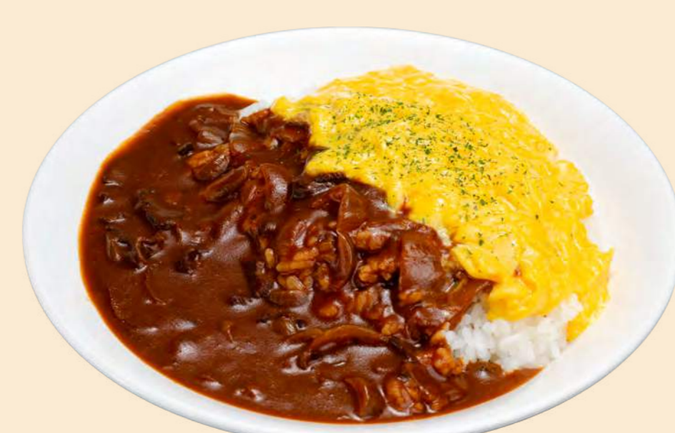
沼田産コシヒカリ稲姫米を使用 ふわとろ ハヤシライス 1,200円