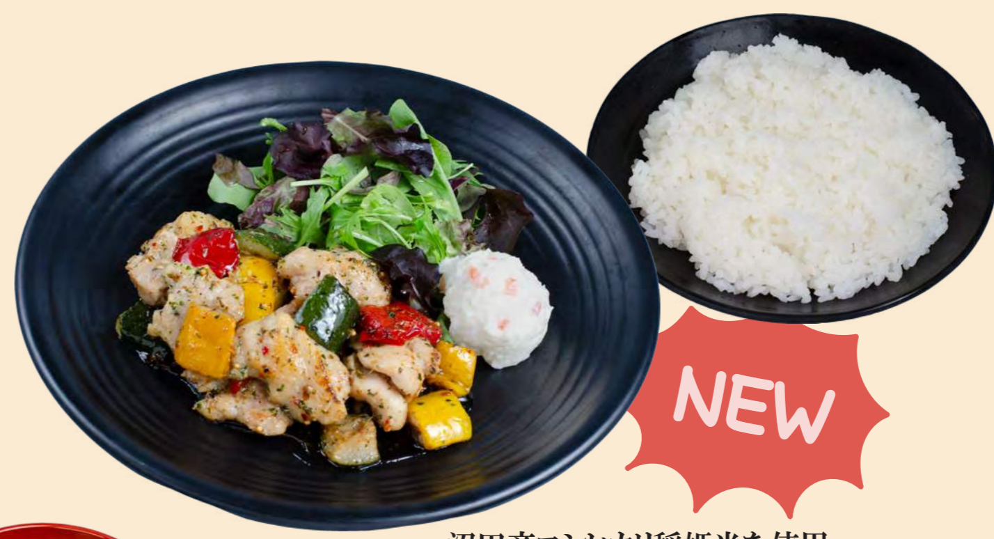
沼田産コシヒカリ稲姫米を使用 NEW バジルチキンランチ 1,200円