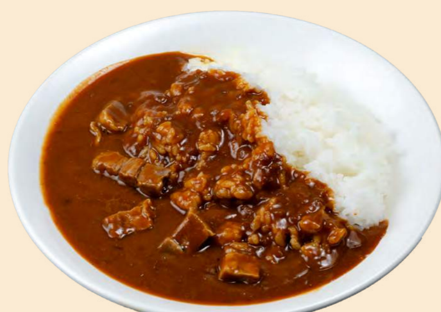
沼田産コシヒカリ稲姫米を使用 特製ビーフカレー 1,200円 (大盛 + 400円)