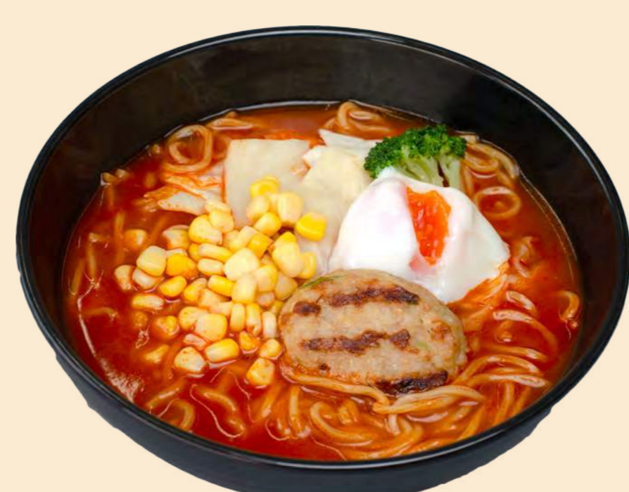
とまとラーメン 1,100円