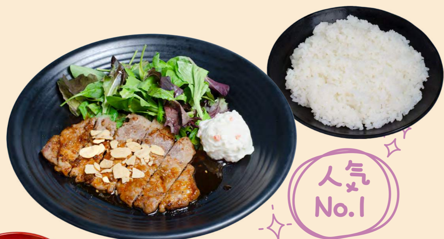
沼田産コシヒカリ稲姫米を使用 上州麦豚ステーキランチ 1,500円