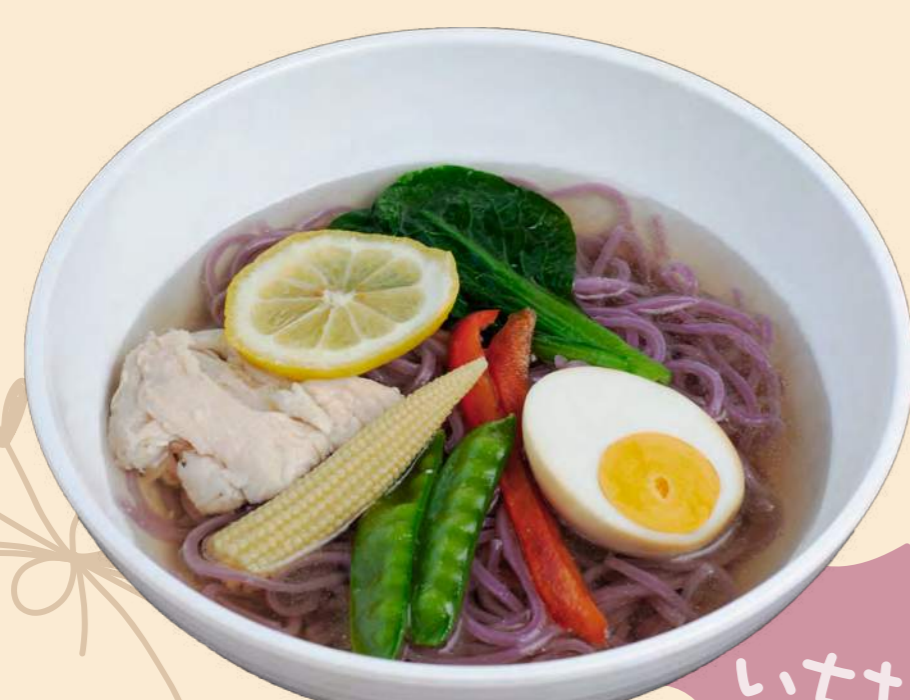
いちおし 冷やしラベンダー ラーメン (塩) 1,100円