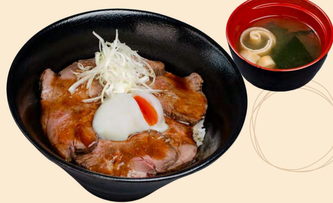
沼田産コシヒカリ稲姫米を使用 上州牛ローストビーフ 1,800円