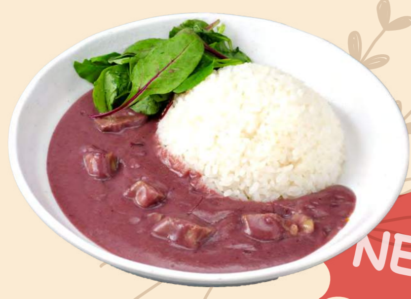
沼田産コシヒカリ稲姫米を使用 NEW ラベンダーカレー 1,200円